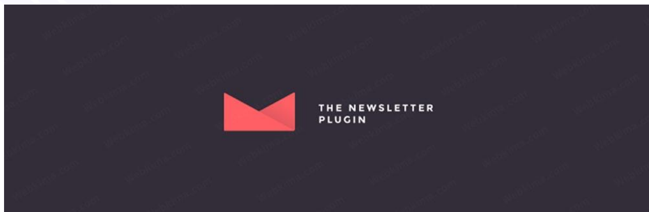
افزونه ایمیل مارکتینگ Newsletter