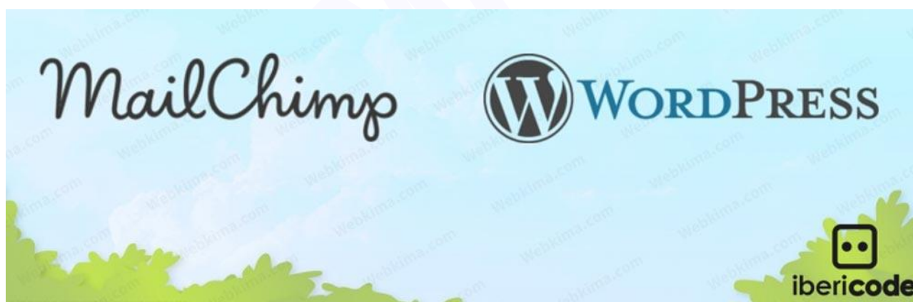
MCFWP: Mailchimp for WordPress افزونه

اگر می‌خواهید بخش خبرنامه و ایمیل مارکتینگ را در وردپرس راه‌اندازی کنید و به دنبال بهترین افزونه ارسال خبرنامه برای وردپرس هستید پیشنهاد تیم وبکیما به شما استفاده از افزونه Mailchimp for WordPress یا MCFWP است، در واقع این یک افزونه رایگان است که پنل وردپرس شما را به سرویس ایمیل مارکتینگ میل چیمپ متصل می‌کند، بنابراین اگر می‌خواهید یک خبرنامه حرفه‌ای در سایت خود راه‌اندازی کنید یکی از بهترین انتخاب‌ها همین افزونه است.