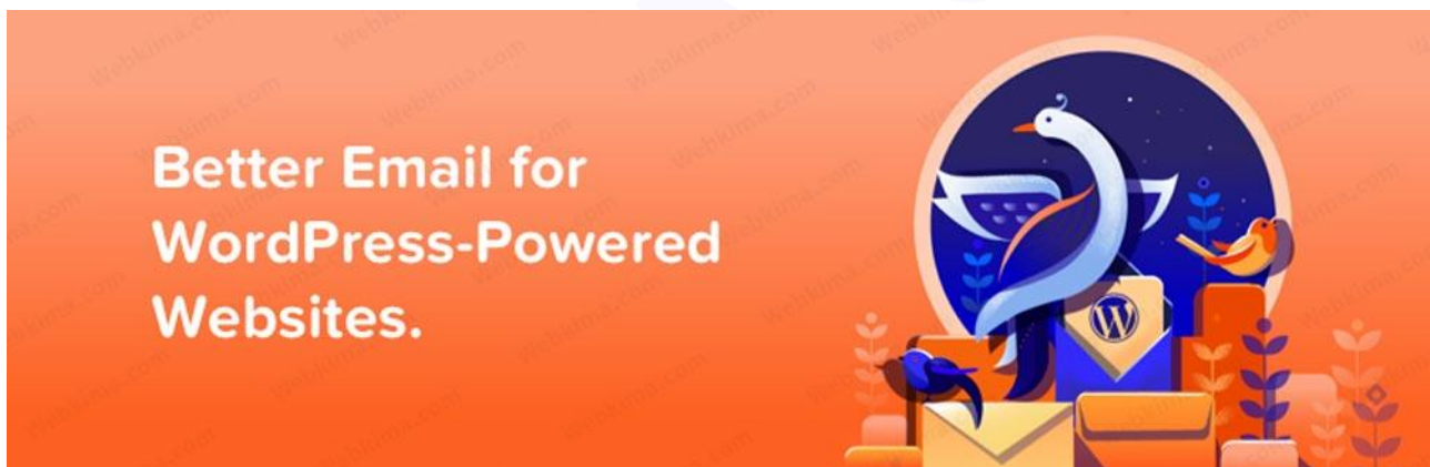
بهترین افزونه خبرنامه وردپرس MailPoet

اگر می‌خواهید بهترین افزونه ایمیل مارکتینگ و خبرنامه در وردپرس را انتخاب کنید، افزونه MailPoet یکی از بهترین انتخاب‌های شما خواهد بود، جالب اینجاست که شما با استفاده از این افزونه می‌توانید لیست ایمیل خود را گسترش دهید و علاوه بر آن می‌توانید از پنل سایت وردپرسی خود برای مشتریان و کاربران خود ایمیل ارسال کنید.