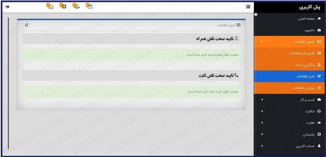
احراز اطلاعات برای دریافت نماد اعتماد الکترونیک

تایید شماره تلفن ثابت: به منظور احراز تلفن ثابت، شماره‌ای درج شده که باید با آن تماس بگیرید. پس از برقراری تماس و گذشت ۱۰ دقیقه، این قسمت برای شما سبز خواهد شد. در این صورت، احراز هویت شما گزارش داده می شود.