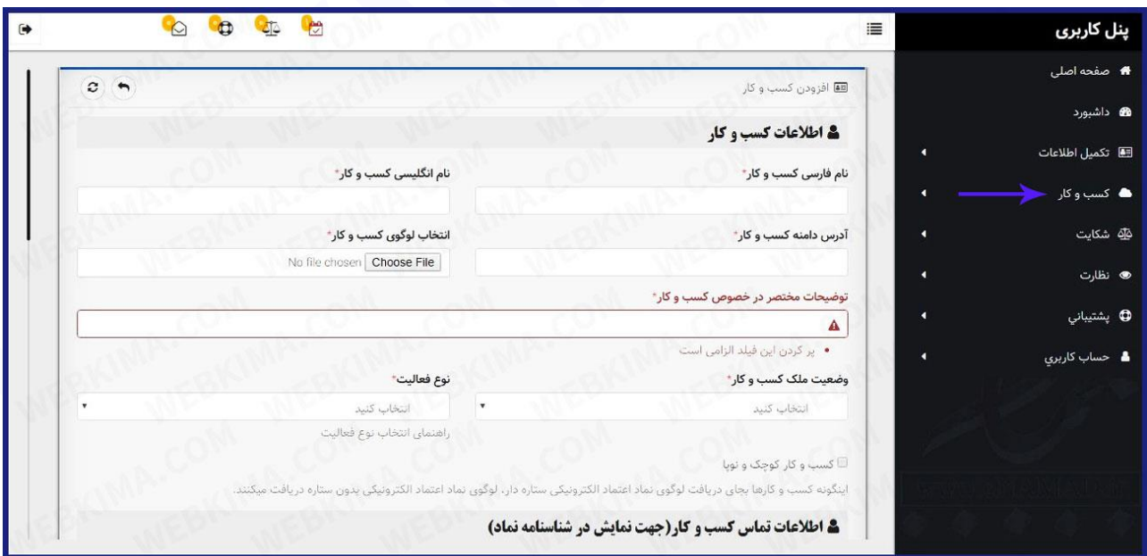
فرم اطلاعات کسب و کار برای ارسال درخواست ای نماد

از پنل کاربری، منوی کسب و کار را انتخاب کنید. در این قسمت باید تمامی اطلاعات مورد نیاز در مورد کسب و کار خود را در فرم مشخص شده با دقت وارد کنید: