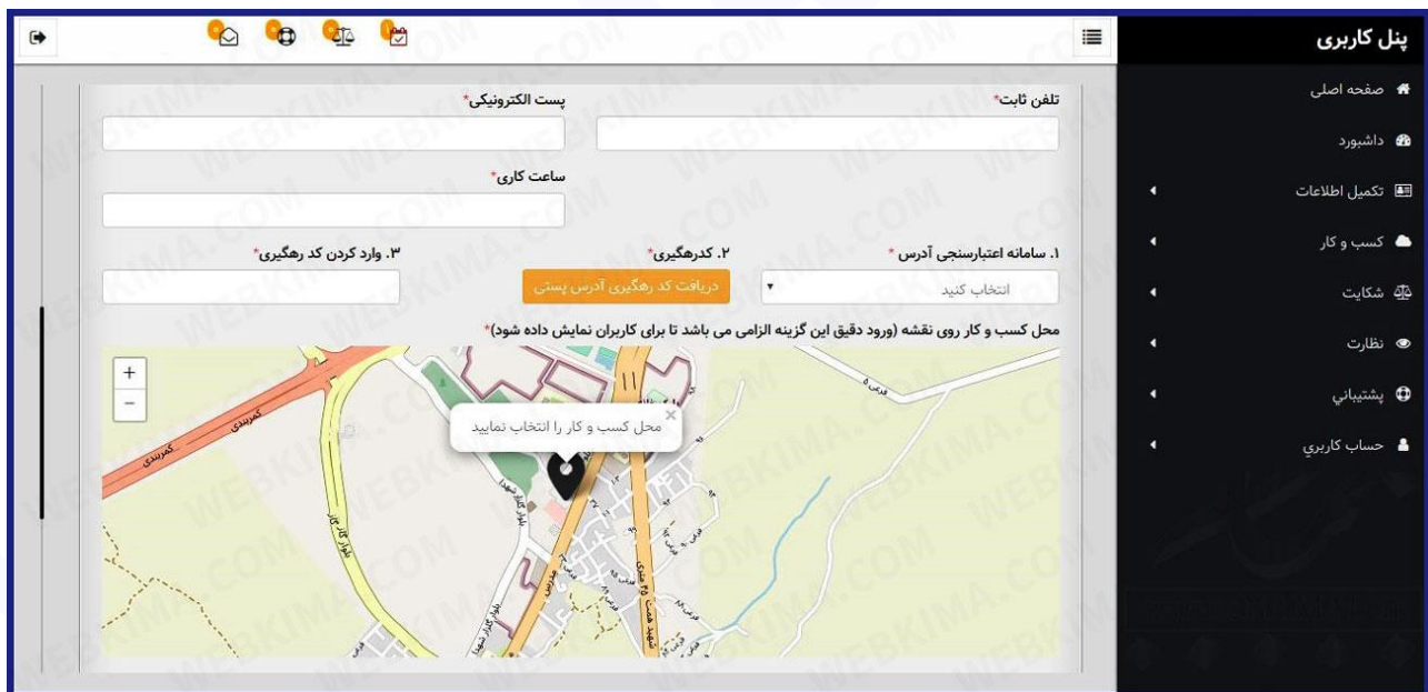
ادامه فرم اطلاعات کسب و کار برای ارسال مدارک اینماد