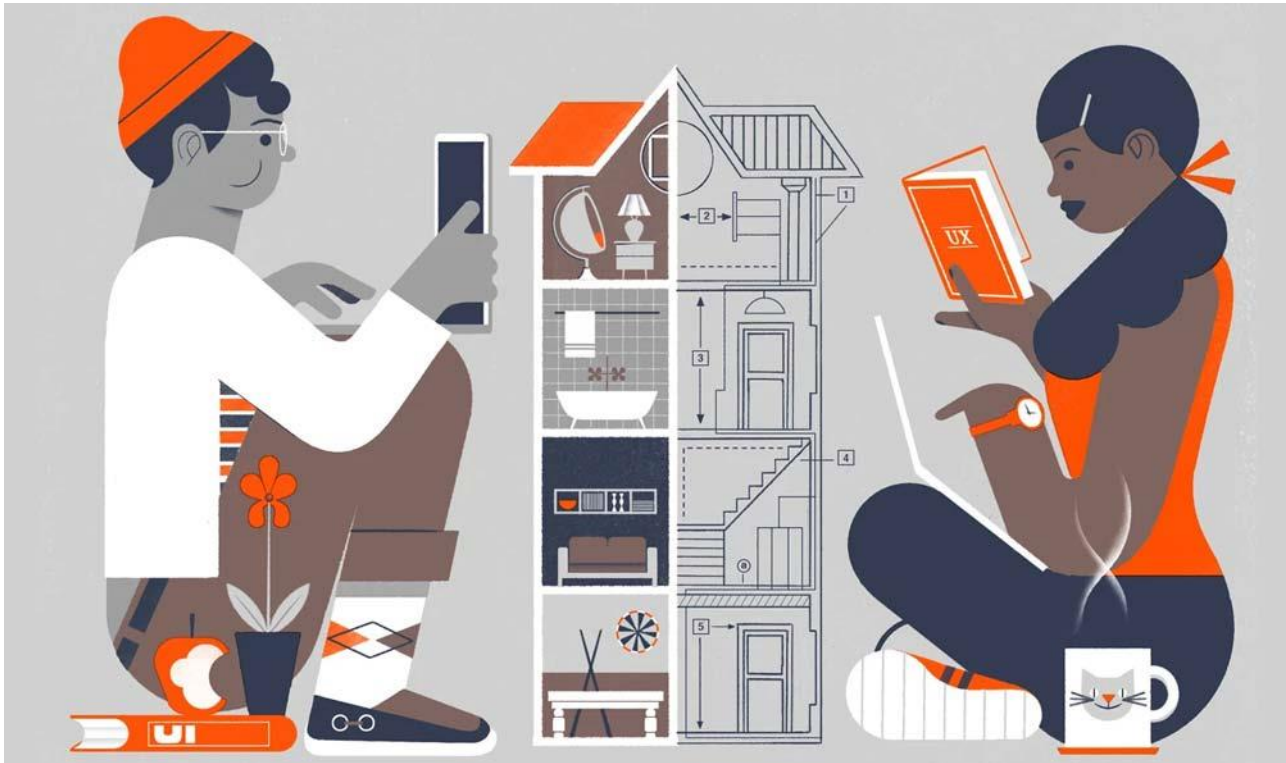
، تفاوت‌های بین رابط کاربری و تجربه کاربری UX و UI تفاوت

در دنیای دیجیتال که زندگی همه ما و به‌ویژه وبمستران را به خود درگیر کرده است، دو موضوع خلاقیت و تکنیک مورد اهمیت قرار می‌گیرد. بعد از آن اصطلاحات رابط کاربری UI و تجربه کاربری UX معنا پیدا می‌کند. حتماً می‌دانید که این دو موضوع تا چه حد برای طراحان سایت مهم است و می‌تواند نقش تعیین‌کننده را در پروژه‌های آن‌ها داشته باشد.