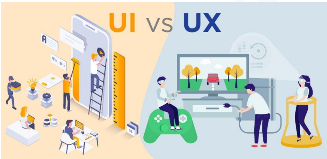
مسئله مکمل بودن تجربه کاربری و رابط کاربری

با توجه به تفاوت UI و UX کاملاً مشخص است که این دو عبارت اختصاری به صورت مستقل کار نمی‌کنند، بلکه می‌توانند مکمل هم باشند. تجربه کاربری و رابط کاربری هر دو هدف مشترکی را دنبال می‌کنند، آن‌ها می‌خواهند که کاربران نسبت به سایت احساس و تجربه خوبی داشته باشند. تجربه کاربری تعیین می‌کند که کاربر برای رسیدن به اهداف خود باید چه مسیری را طی کند. در صورتی که رابط کاربری مسیر عبور کاربر را زیباسازی می‌کند و به آن جذابیت می‌بخشد. همه این عوامل دست‌به‌دست هم می‌دهند که بازدیدکننده سایت بدون کوچک‌ترین مشکلی به موضوعات موردنظر خود در سایت دسترسی داشته باشد.